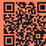
上市町公式ホームページ

◎指定医療機関で行う施設検診（胃内視鏡検査・バリウム検査及び大腸がん検診）は12月末で終了です。お早めに指定医療機関へご予約ください。⇒指定医療機関は5月に全戸配布した『令和5年度上市町がん検診・健康診査のお知らせ』または上市町公式ホームページをご覧ください。