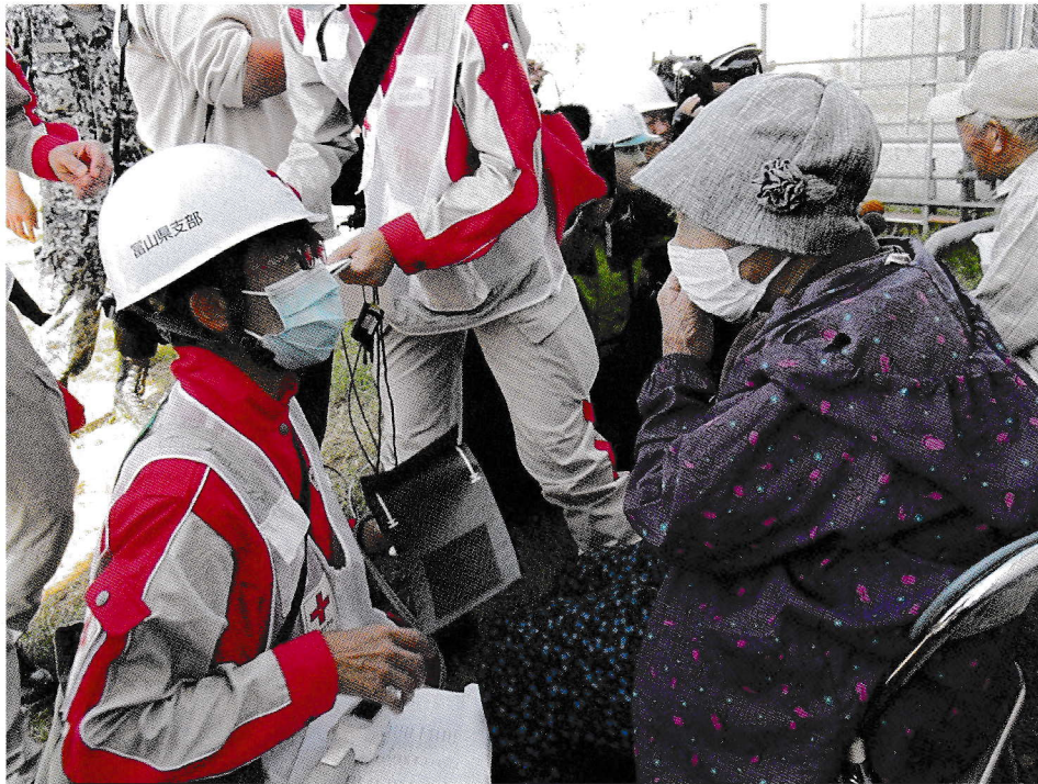
自衛隊ヘリでの避難者に健康状態を確認する富山県支部救護班（9月26日）

元日の能登半島地震からの復興もままならないうちに発生した、令和6年9月21日の能登半島大雨災害。