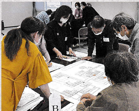
『ひなんじょたいけん』に取り組む奉仕団員