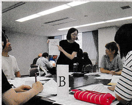
互いに『災害への備え』をプレゼンする講習指導員

日本赤十字社富山県支部の講師から、能登半島地震を振り返りながら、地図の上に一人ひとりの防災意識をイメージして掘り下げていくための講話を受け、40グループは、生徒会メンバーの進行のもと、自分たちの地域の危険や防災力、被害を減らすための気づきを得ていました。