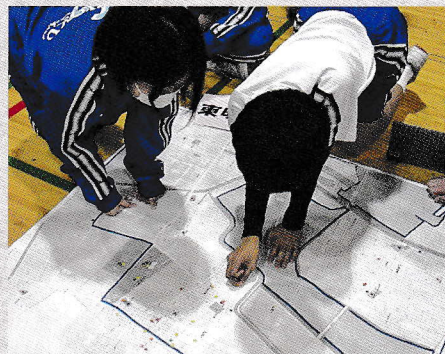
射北中学校での「DIG」の様子

DIGとは・・・Disaster（災害）Imagination（想像）Game（ゲーム）の略称。